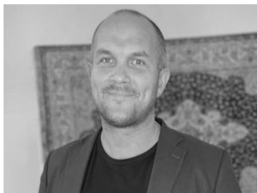
Matthías Rúnarsson Skrifstofa og bókhald