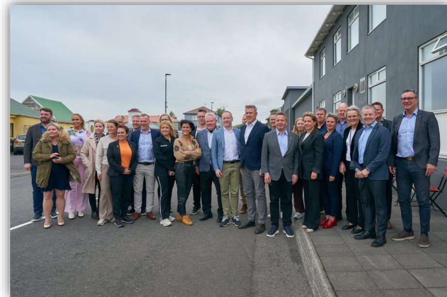
Ríkisstjórnin fundaði með sveitarstjórnarfólki á Norðurlandi vestra og SSNV þann 28. ágúst 2024 í Skagafirði.

Samtökin koma einnig að skipulagningu viðburða í samstarfi við hagaðila.